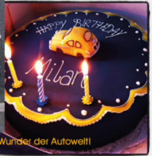
Die 1. Fahrt mit dem kleinem Wunder der Autowelt!