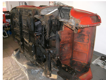
Dann wird der kleine auf die Seite gelegt