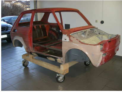
Rohkarosse auf meinem selbstgebauten Fahrgestell dann ab zum Lackierer