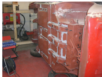
Unterboden Grundiert und abgedichtet