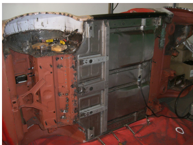
Nach vielen Stunden ist der neue Unterboden sowie Innenradhaus und Kotflügel eingeschweißt.