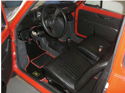
Fast schon wie ein Fabrikneues Auto