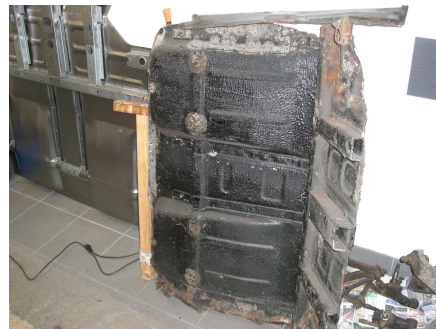
So endlich geschafft, Unterboden ist raus und neuer steht schon bereit.