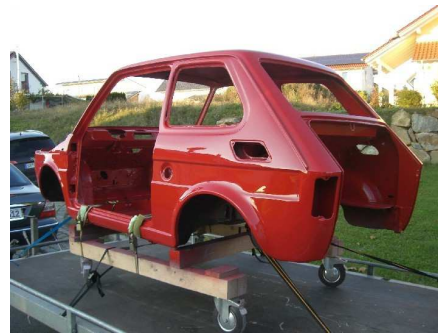
Endlich vom Lackieren fertig, Farbe rosso corso