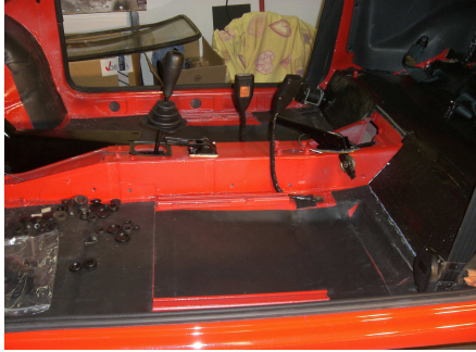
Der Innenraum wird wieder mit Dämmplatten versehen