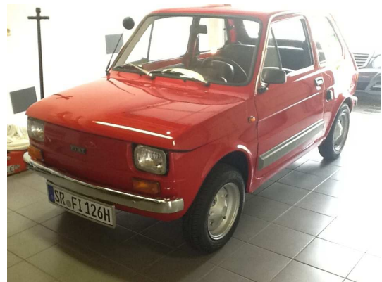
Nun ist mein kleiner fertig mit Oldtimerzulassung und Wertegutachten