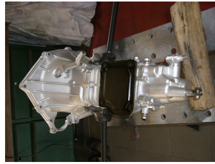
In der Zwischenzeit wird das Getriebe herrgerichtet