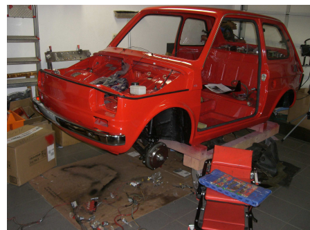
Sieht doch schon wieder ganz schnuckelig aus