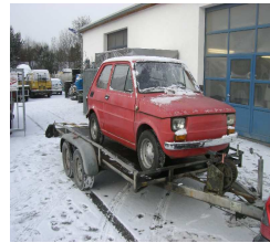
Abholung am 22.12.2009