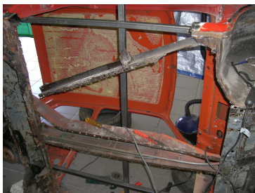
Zuerst wurde innen eine Verstrebung eingeschweißt und dann der Kpl. Unterboden sowie die Innen- und Aussenschweller rausgetrennt.