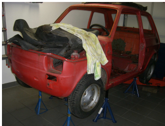
Fahrzeug wird komplett gestriipt