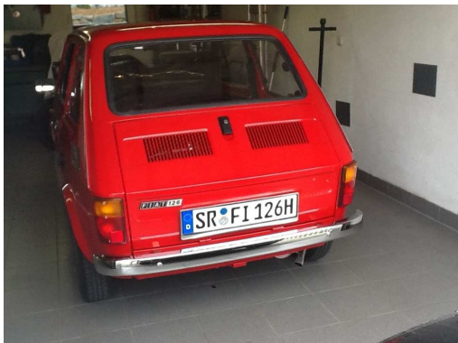
Fertigstellung am 05.07.2012 nach unzähligen Stunden Arbeit und ca. 7.500,-- € Investkosten