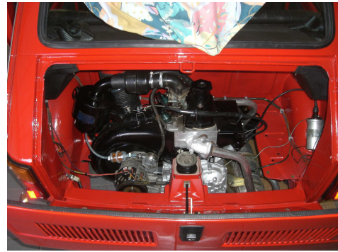
Das Aggregat ist wieder an seinem Platz verbaut